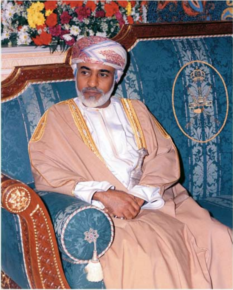
حضرة صاحب الجلالة السلطان قابوس بن سعيد المعظم His Majesty Sultan Qaboos Bin Said